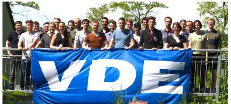
Studierende aus Saarbrücken, Kaiserslautern und Trier beim ersten, aber sicher nicht letzten VDE Summer Camp

Für die VDE Hochschulgruppe Saarbrücken war 2022 ein ereignis- und erfolgreiches Jahr. Neben dem vorbildlichen Mitgliederzuwachs konnte in einem überregionalen Event, dem „VDE Summer Camp“, eine neue Veranstaltung ins Portfolio der Hochschulgruppe aufgenommen werden. Dieses fand erstmals in diesem Jahr mit mehr als 30 Teilnehmer:innen aus den Hochschulgruppen Saarbrücken, Kaiserslautern und Trier statt. Die Veranstalter konnten mit Hilfe von Sponsoren ein vielfältiges Programm aufstellen. Highlights waren unter anderem: